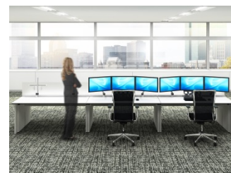
スモールオフィス