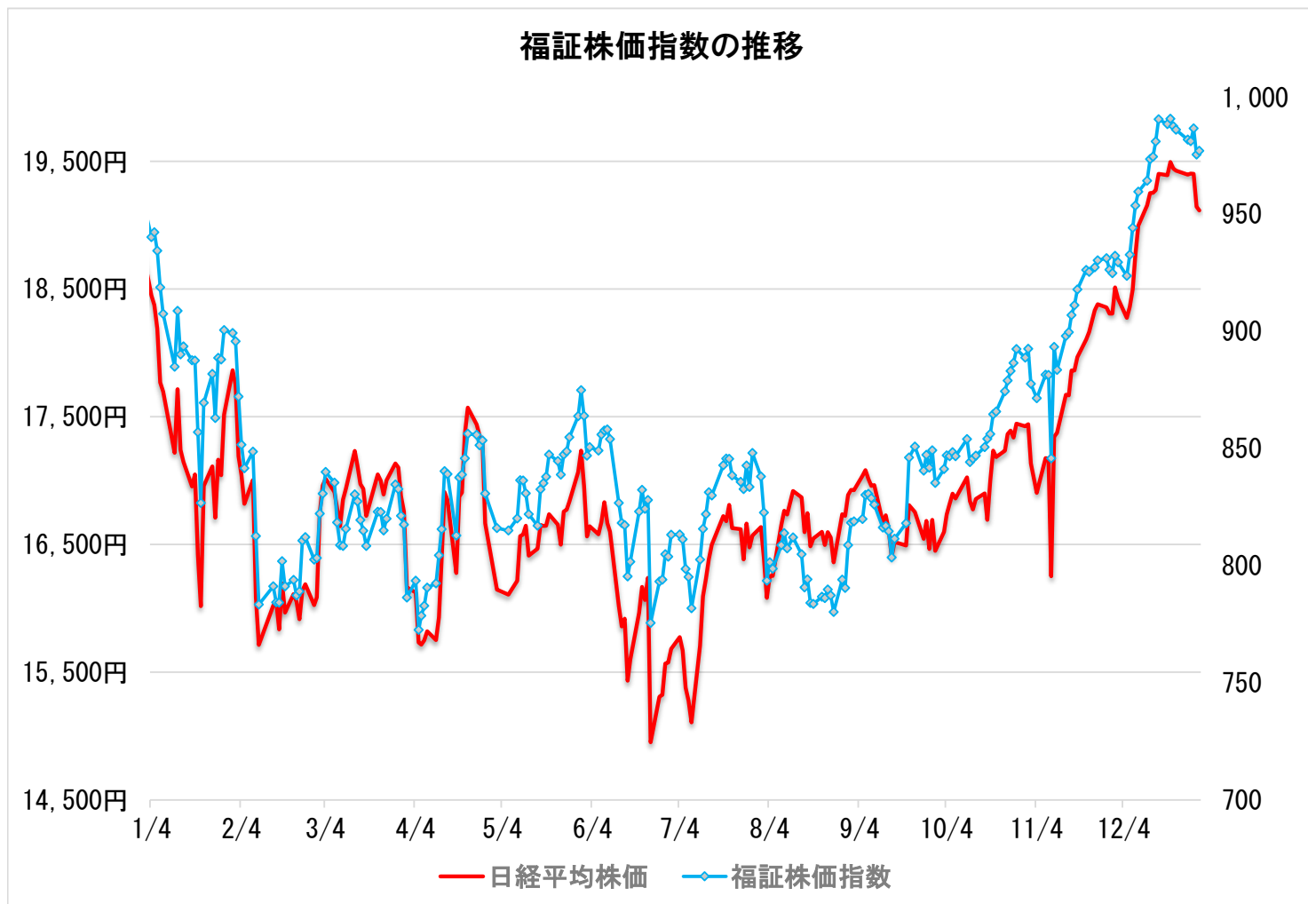
福証株価指数の推移